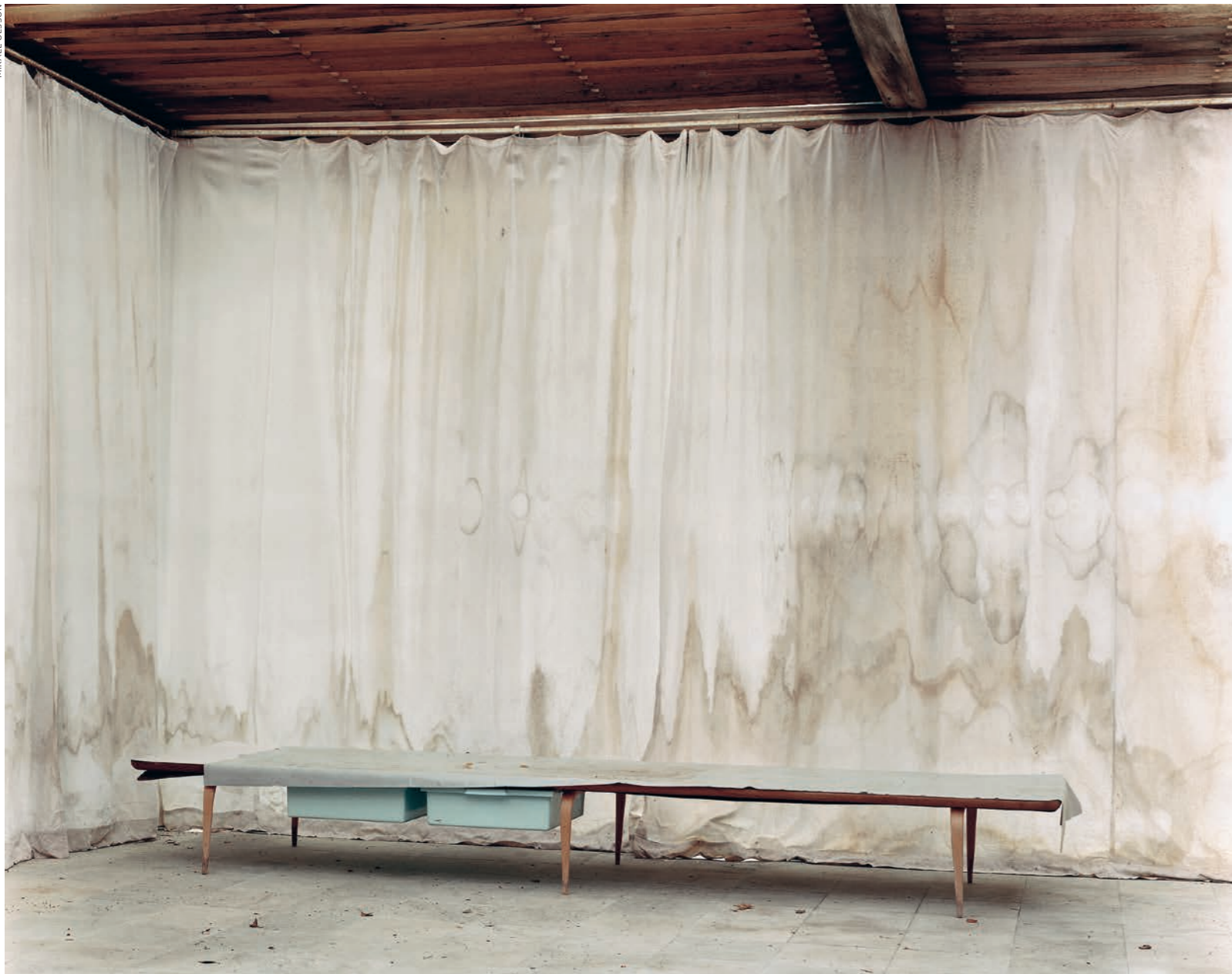
Till vänster: FK15.2004 från Mikael Olssons »Södrakull Frösakull« (Steidl).