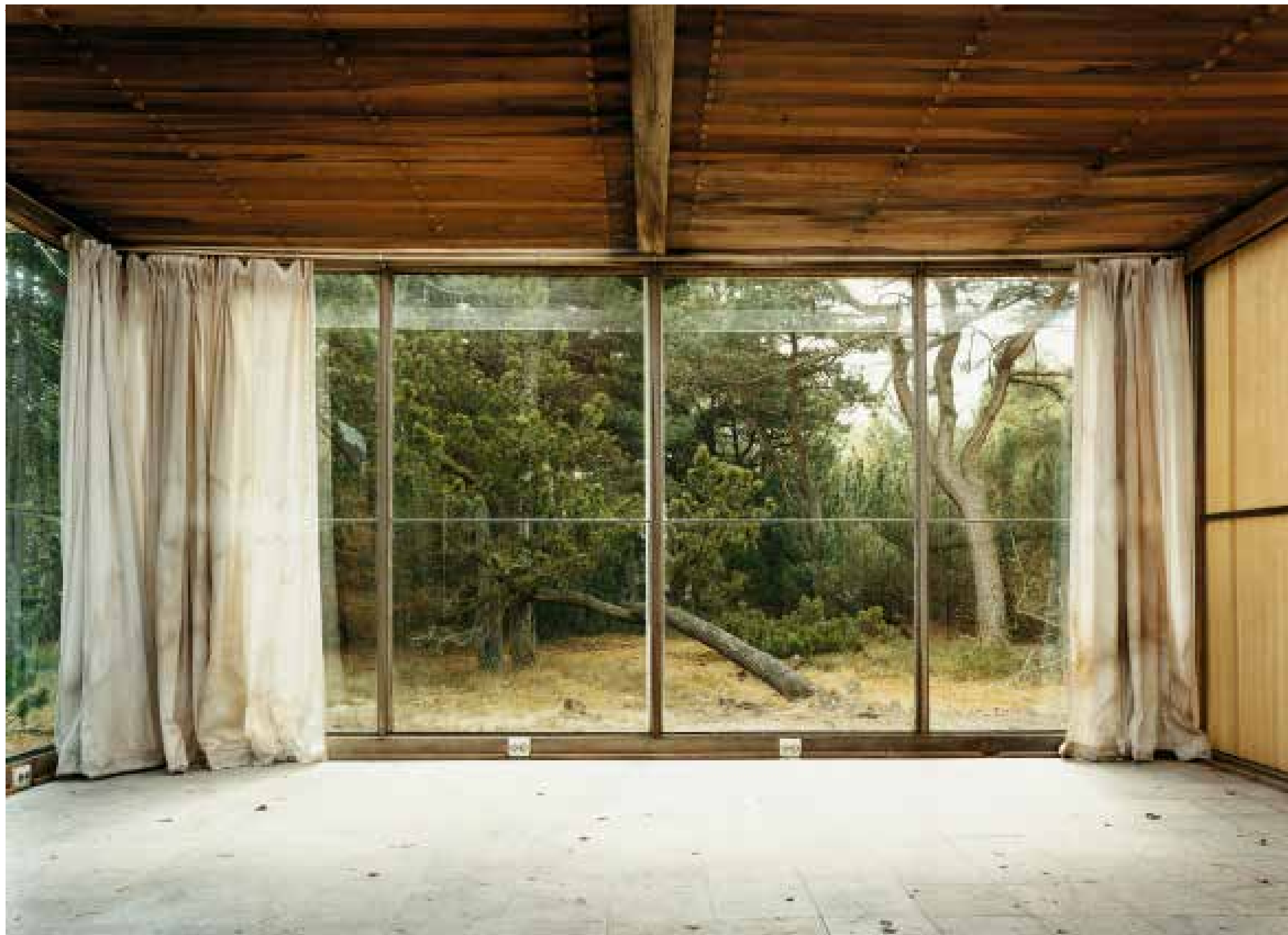
FK03.2003 © Mikael Olsson, C-print, Galerie Nordenhake (Från serien Södrakull Frösakull)